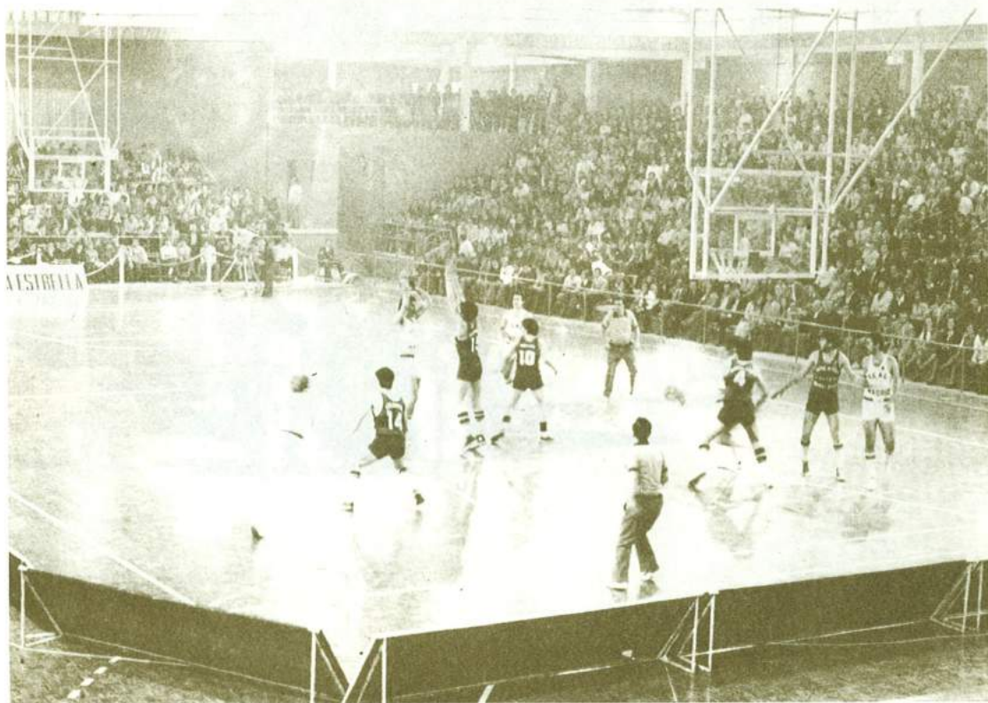
El Real Madrid i el Club Joventut, representants de Castella i de Catalunya, respectivament, durant tants anys, en la final de Copa a Cartagena. Any 1975.

com a espais esportius. Això sí, els animava un afany de participació i un amor a la Penya irrefutables.