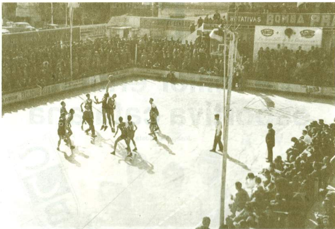
Camp de joc de la Plana, després pavelló municipal regentat pel Club Joventut, reclamat actualment pel municipi.

valors humanes que la idealitzaren, mancats com estem de documents històrics que en garanteixin un perfecte coneixement. Seguint, doncs, el patró de la meva recent publicació «DESPERTA, FERRES!», de tan bona collida en els medis esportius, profito aquesta oportunitat immillorable per subministrar nova informació, cada vegada més esblaimada en el record dels vells fundadors d'aquesta agrupació cinquantenària.