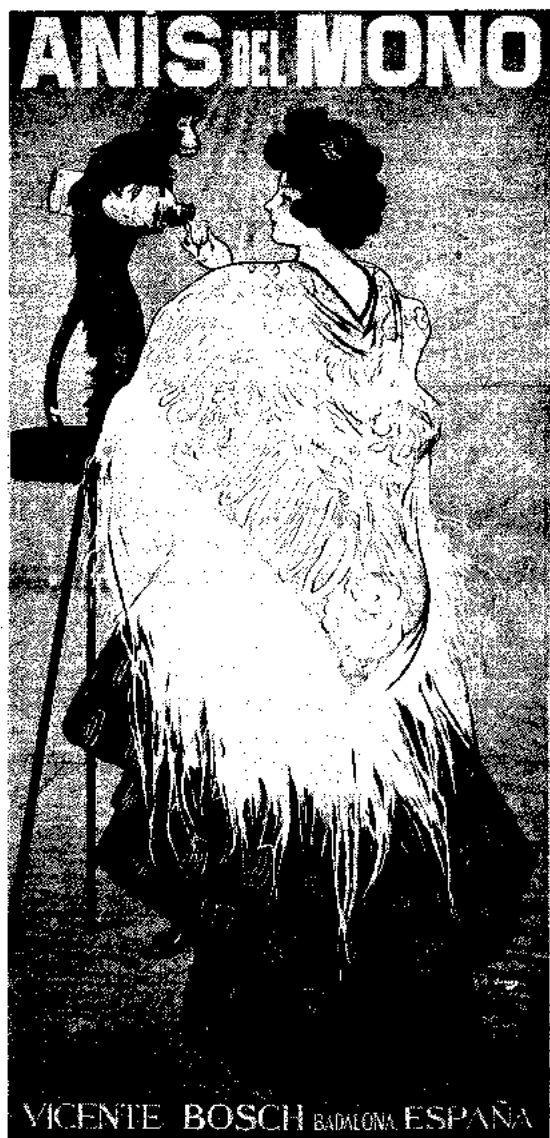
Primer accessit. Ramon Casas *