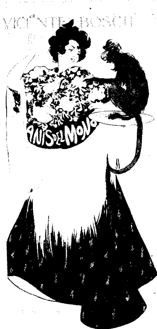
Segon accessit. Ramon Casas *