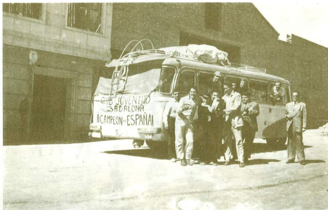
Grup de jugadors que l'any 1953 conqueriren el títol de campions d'Espanya, a Valladolid.

Malgrat tot, el testimoni fidel d'un grapat de protagonistes consultats, ens parla d'un grup de joves esportistes que, en estreta amistat practicaven el basquetbol en un caire recreatiu, a part d'altres modalitats esportives i a part també les seves genialitats espontànies pel veïnat.